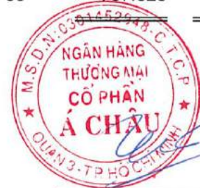
Trần Hùng Huy Chủ tịch Hội đồng Quản trị Ngày 10 tháng 8 năm 2022