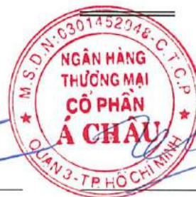
Trần Hùng Huy Chủ tịch Hội đồng Quản trị Ngày 10 tháng 8 năm 2022